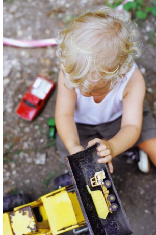
Bindung und Beziehung